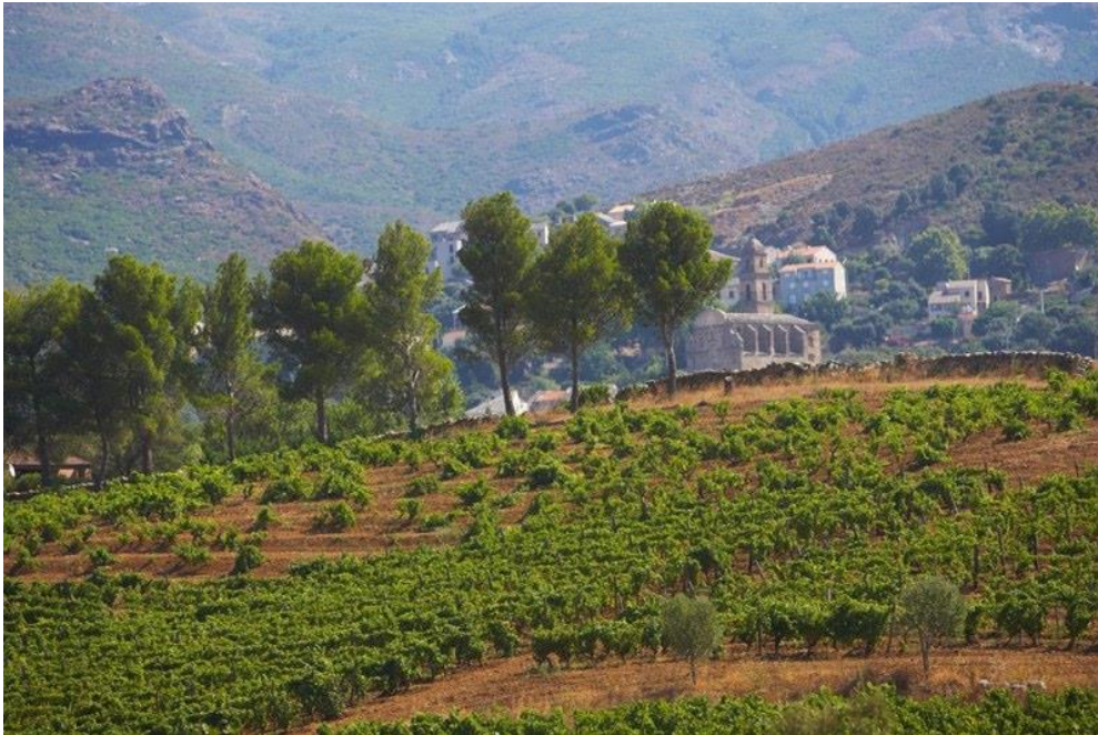
Morta Maïo wijngaard

Van 100% niellucciu uit de Carco wijngaard. Heeft 6 maanden gerijpt op foeders van 600 liter. Animale geur. De smaak wordt getypeerd door het terroir. Fijne, mooie tannines geven levendigheid. Finale met verfijning.