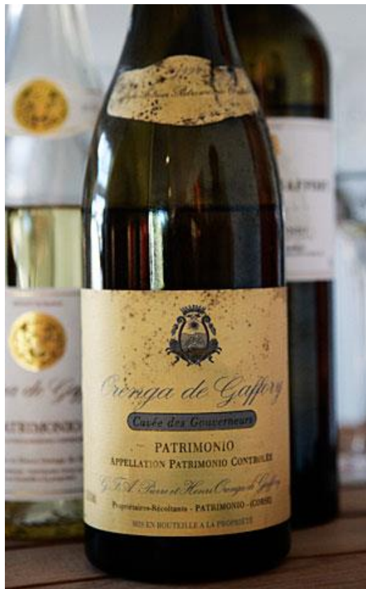
Cuvée des Gouverneurs Blanc 1992