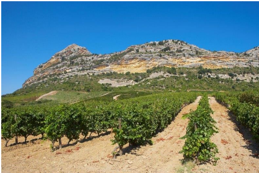
Grotte di Sole wijngaard