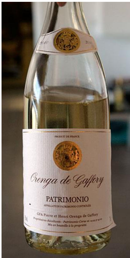
Cuvée Orega de Gaffory Blanc 2010

Er wordt gewerkt met moderne uitrusting en apparatuur. De kelder heeft een klimaatregeling. Geselecteerde lots muscat en vermentinu rijpen op barriques, niellucciu op foeder. Er wordt geen gebruik gemaakt van microbullage om de tannines van de rode wijnen te verzachten, de resultaten daarvan waren teleurstellend. Dit domaine is op zoek naar een importeur in Nederland.