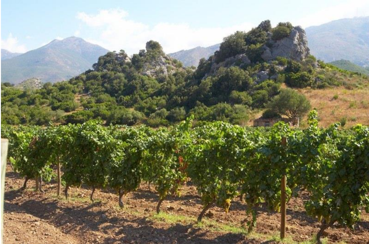
Perceel met biancu gentile

In 1997 werd dit witte druivenras aangeplant, de eerste oogst was die van 2000. Antoine Arena gelooft er erg in. De vinificatie is gelijk aan die van de vermentinu. Alc. 13,8%. Subtiel karakter met fijne, levendige expressie. Speelse smaak van delicaat wit en geel fruit met karakter van vuursteen. Een voorjaarswijn bij uitstek.