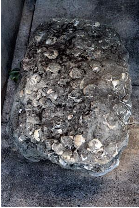
steen met schelpen van 18 miljoen jaar oud