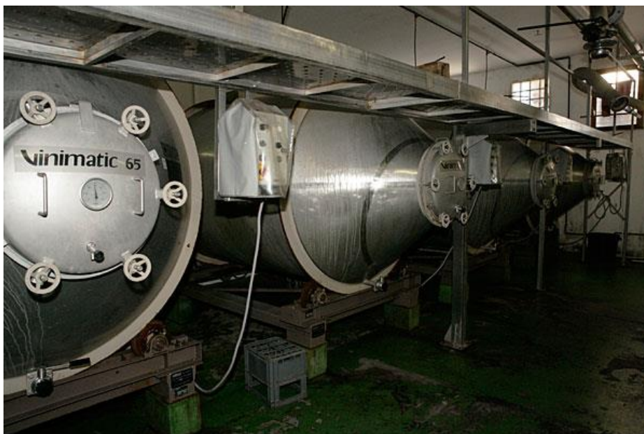
Roterende Vinimatic tanks